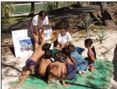
En Moorea, Polinesia francesa

El Día Mundial del Océano permite cada año celebrar el Océano Mundial y la diversidad de sus riquezas; sacar a la luz los programas de sensibilización, de educación y de acciones destinadas a promover un Océano sano y productivo, y de recordar a las naciones, a los gobiernos, a las empresas y a los individuos cuáles son sus responsabilidades para proteger el Océano Mundial y preservar sus recursos para las generaciones presentes y las que vendrán.