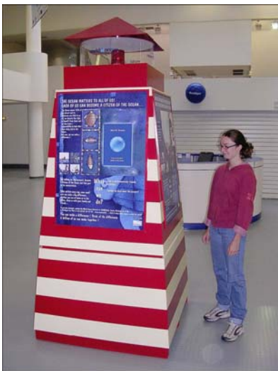
Exhibición en NAUSICAA, Francia

El módulo tiene por objetivo informar a la mayor cantidad posible de personas en todos lugares (centros comerciales, estaciones, etc.). El módulo debe ser simple, sólido, fácil de reproducir y adaptado a todo tipo de dificultades culturales y condiciones de presentación.