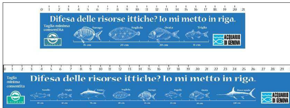
Reglas distribuidas por el acuario de Génova, Italia

graduadas donde se brindan consejos en cuanto a las tallas de reproducción mínimas y al tipo de pescado a comprar.